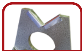
Inserto em Aço Tratado