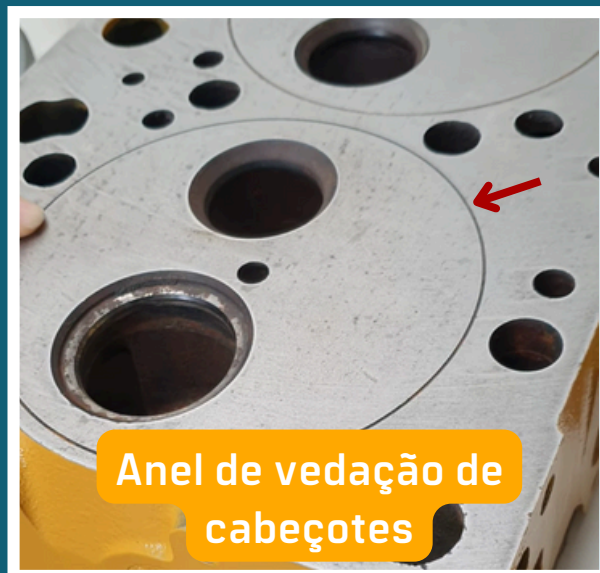
Anel de vedação de cabeçotes